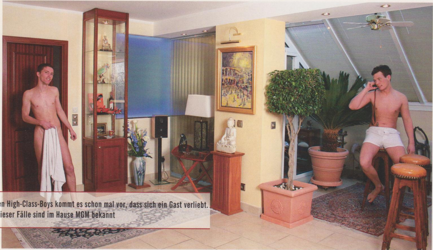
Bei den High-Class-Boys kommt es schon mal vor, dass sich ein Gast verliebt. Drei dieser Fälle sind im Hause MGM bekannt